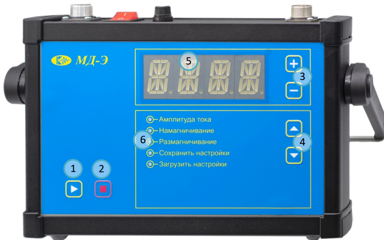
РИС. 4.3А ПЕРЕДНЯЯ ПАНЕЛЬ МОДУЛЯ МД-Э:

1 - КНОПКА «ПУСК»; 2 - КНОПКА «СТОП»; 3 - «+», «-» УВЕЛИЧЕНИЕ И УМЕНЬШЕНИЕ ТОКА; 4 - КНОПКА ВЫБОРА ПУНКТОВ МЕНЮ; 5 - ЦИФРОВОЙ ИНДИКАТОР; 6 - МЕНЮ.