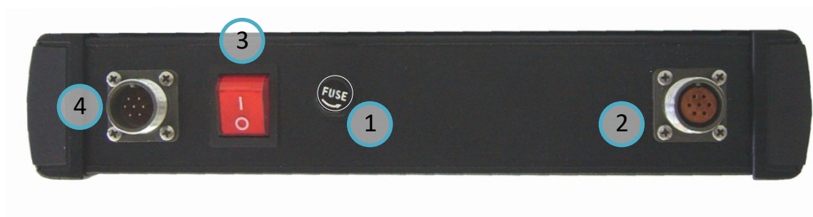
РИСУНОК 4.3Б ВЕРХНЯЯ ПАНЕЛЬ МОДУЛЯ МД-Э:

1 - КНОПКА «ПУСК»; 2 - КНОПКА «СТОП»; 3 - «+», «-» УВЕЛИЧЕНИЕ И УМЕНЬШЕНИЕ ТОКА; 4 - КНОПКА ВЫБОРА ПУНКТОВ МЕНЮ; 5 - ЦИФРОВОЙ ИНДИКАТОР; 6 - МЕНЮ.